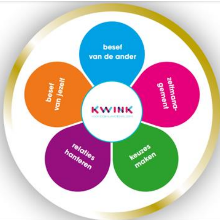
De 5 competenties voor sociaal-emotioneel leren van Kwink

De fase van afscheid, deze fase verloopt vaak wat onrustig.